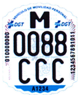
Modelo de etiqueta identificativa

Dicha etiqueta deberá colocarse en el porta-identificador destinado a tal efecto en el vehículo una vez que disponga de ella. En el caso del VMP no certificados, se podrá colocar en lugar visible.